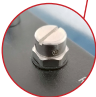
Valvola di sicurezza Safety valve