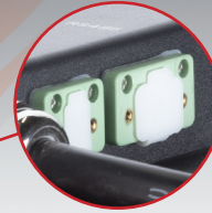
Connettori per display e CAN BUS Display and CAN BUS connectors