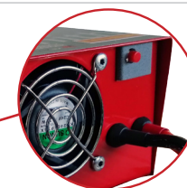
Pulsante per riarmo BMS BMS restart push button