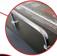
Maniglie per il trasporto Transport handles