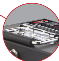
Maniglie per il trasporto Transport handles