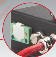
Connettori per display e CAN BUS Display and CAN BUS connectors