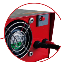
Pulsante per riarmo BMS BMS restart push button